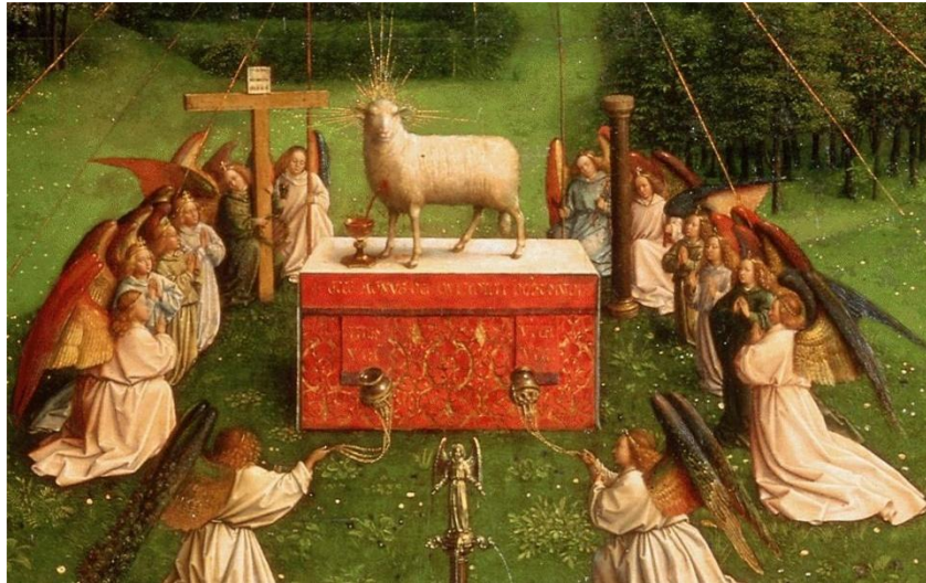
Agneau mystique des frères Van Eyck

Jean-Baptiste pressent d'où tu viens, il t'accueille d'un cœur purifié.